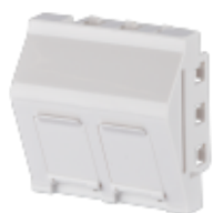
Rys. Przykład płyty czołowej

Punkt logiczny PL zamknięty – modułarny oparty został na płycie czołowej skośnej przeznaczonej do montażu 2 modułów gniazd RJ45. Płyta czołowa ma posiadać klapki przeciwkurczowe i być wyprodukowana przez tego samego producenta, co moduły gniazd, celem zapewnienia 100% dopasowania, długoterminowej niezawodności działania/współdziałania i bezpieczeństwa zastosowania. Płyta czołowa ma być zgodna ze standardem uchwytu typu 45x45mm, celem jak największej uniwersalności i możliwości adaptacji do dowolnego systemu i linii wzorniczej osprzętu elektroinstalacyjnego dowolnego producenta wybranego przez Zamawiającego.